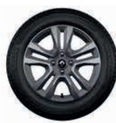
Rin de aluminio Jogger 16"