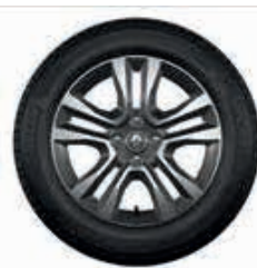
Rin de aluminio Jogger 16" diamantado